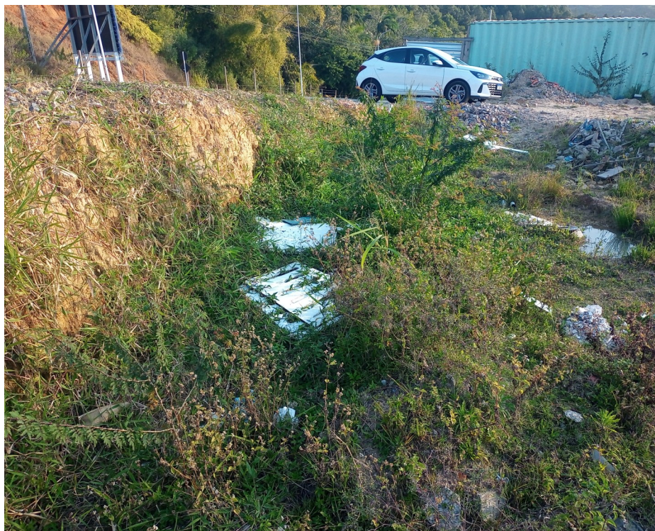
FOTO 09 - Destaque para vegetação e entulhos existentes no local: Deverão ser removidos antes do início dos serviços de infraestrutura e contenções.