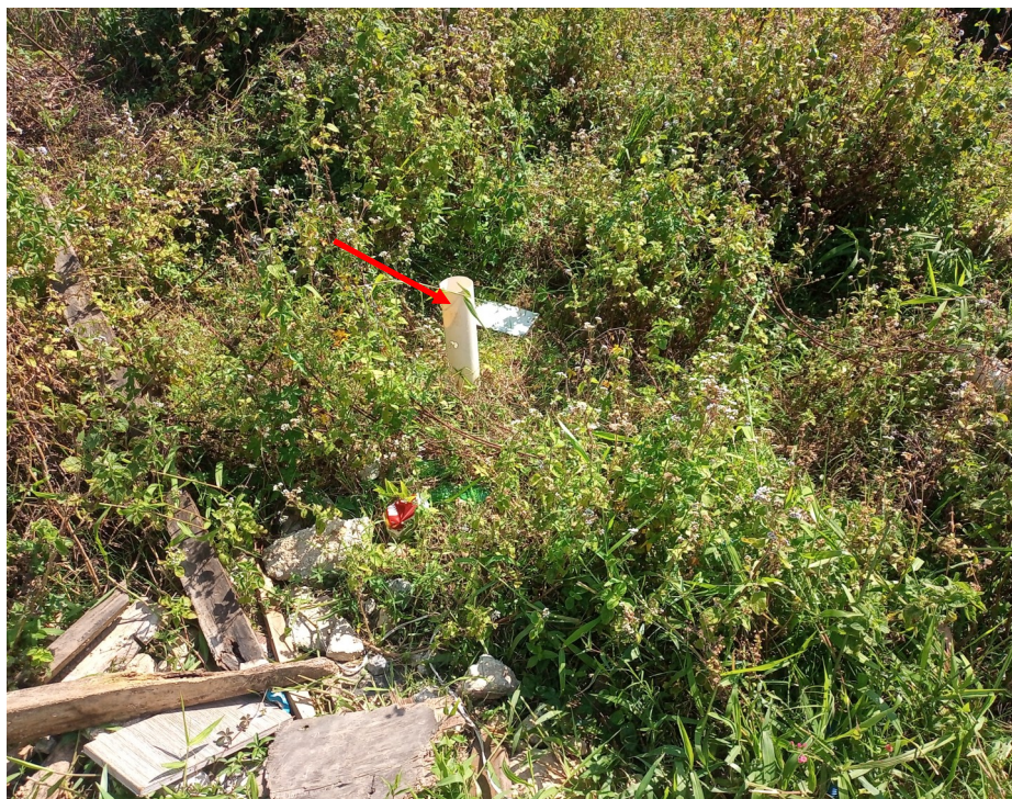
FOTO 14 - Destaque para localização da fossa séptica existente.