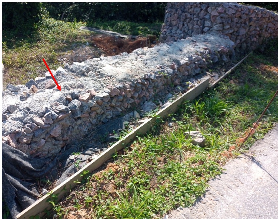
FOTO 06 - Vista parcial das contenções - Acesso ao Mirante Nível 97,00.

Destaque para contenção em pedra argamassada que deverá ser adequada para execução de calçada. Vide projetos executivos.