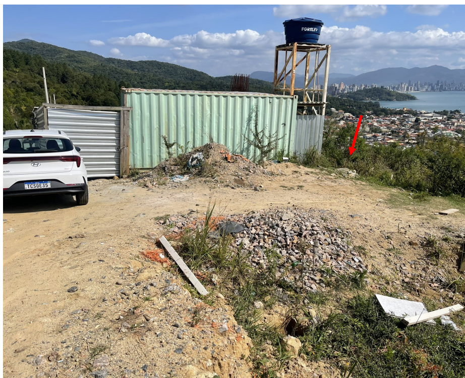
FOTO 13 - Destaque para canteiro de obra e localização da fossa séptica existente.