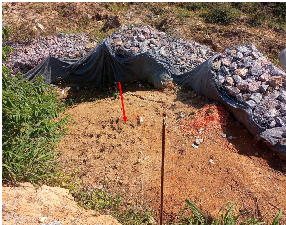
FOTO 08 - Destaque para trecho de aterro sem compactação: Aterro deverá ser removido e relançado com controle de compactação - Vide projetos executivos.