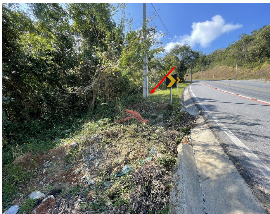
FOTO 02 - Vista parcial do terreno do Mirante.

Destaque para poste de referência utilizado em projetos com coordenadas: