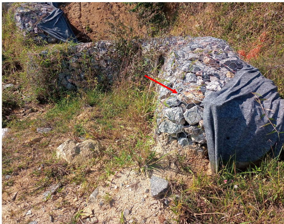
FOTO 12 - Destaque para trecho em gabião à ser removido para execução de infraestrutura e posterior reexecução - Vide projetos executivos.