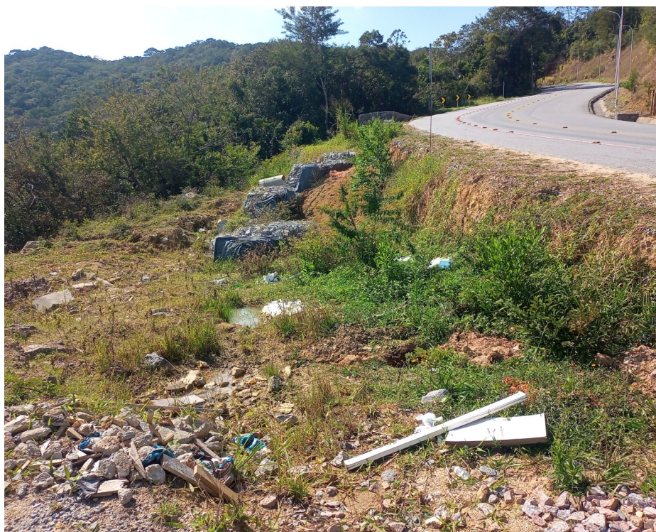
FOTO 01 - Vista parcial do terreno do Mirante.