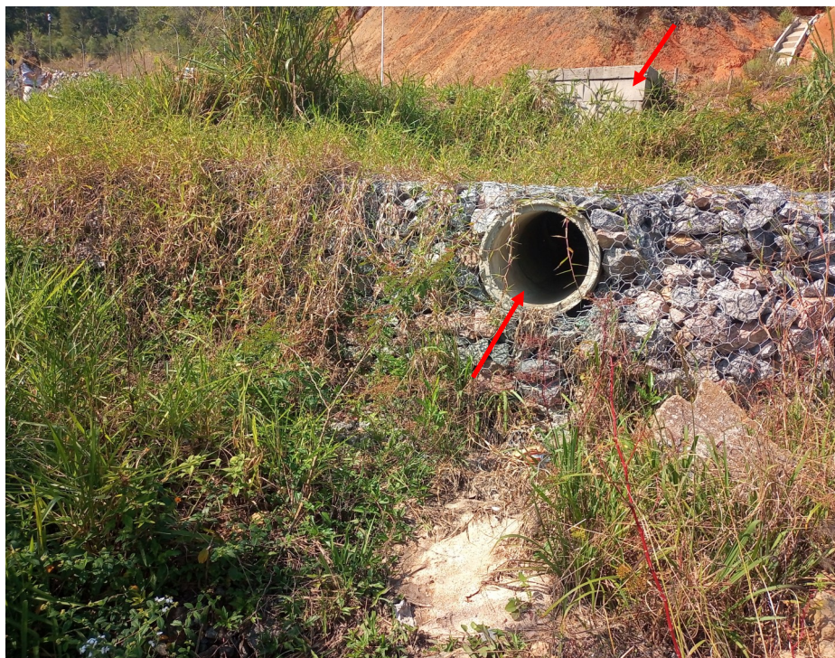
FOTO 10 - Destaque para caixa de passagem da rede pública de águas pluviais e rede existente: Deverão ser demolidas e readequadas - Vide projetos executivos.