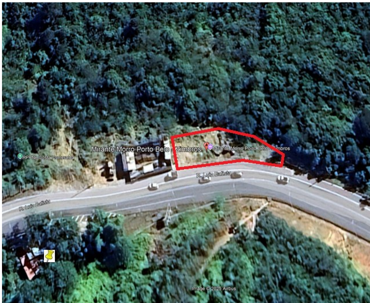
Imagem Google Earth de 28/04/2025 - Acesso em 01/12/2025