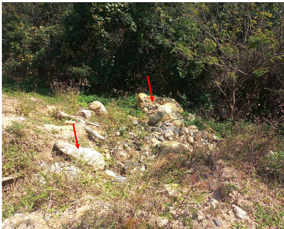
FOTO 11 - Destaque para presença de material de segunda categoria.