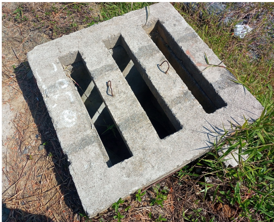
FOTO 07 - Destaque para caixa de passagem da rede pública de águas pluviais: Deverá ser demolida e readequada - Vide projetos executivos.