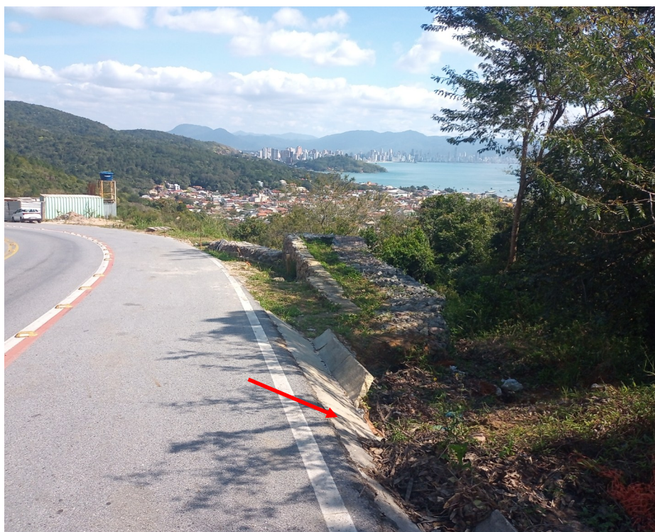
FOTO 03 - Vista parcial do terreno do Mirante.

Destaque para canaleta existente: deverá ser redirecionada por de trás do gabião existente - Vide projetos executivos.