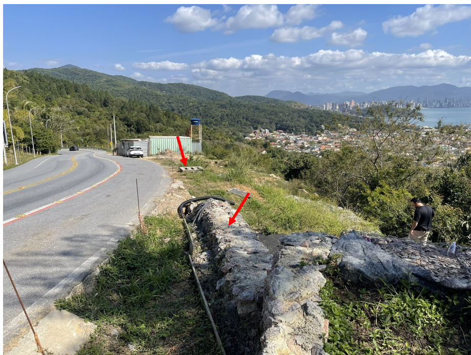
FOTO 04 - Vista parcial do terreno do Mirante.

Destaque para canaleta existente: deverá ser redirecionada por de trás do gabião existente - Vide projetos executivos.