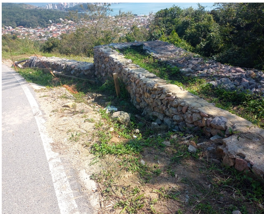
FOTO 05 - Vista parcial das contenções - Acesso ao Mirante Nível 97,00.